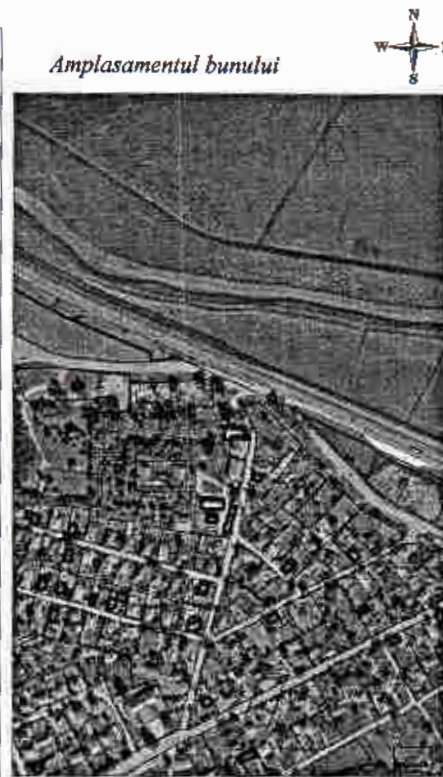
3565 - numarul cadastral al terenului 01 - numarul cadastral al cladirii