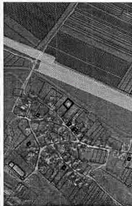
3591 - numărul cadastral al terenului 01 - numărul cadastral al clădirii