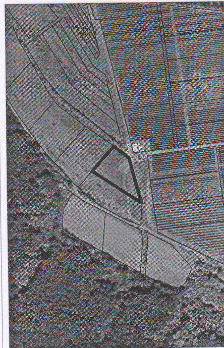
254 - numarul cadastral al terenului